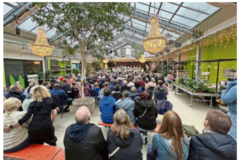
Das Publikum war zahlreich erschienen.