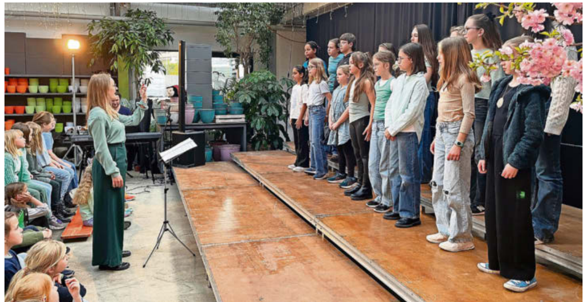
Kinder und Jugendliche aus Russikon und Hittnau begeisterten mit ihrem Gesang im «Unicum».

Nun, vier Jahre später am Palmsonntag und Palmsonntagnach-